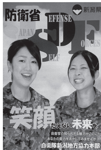
●自衛官を志す方のための募集案内 (資料:自衛隊新潟地方協力本部)

官の紹介と活躍の様子を掲載することについて検討し、自衛官への志願者増加に資するよう努めていく。